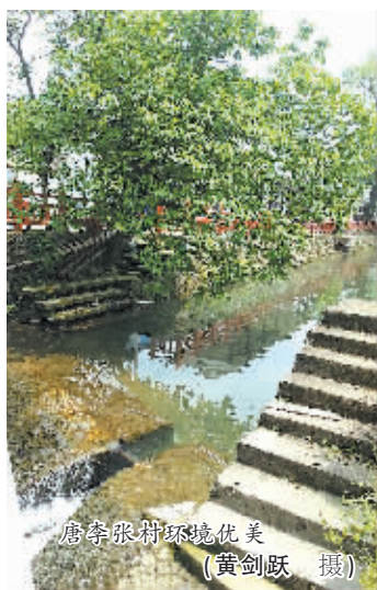
唐李张村环境优美

和项国英相比，无论是年纪还是养猪资历，今年32岁的张贇都要稚嫩一些。然而，20多岁就养猪的他，早在前几年就成为村里最大的养猪专业户，年出栏1500至2000头。