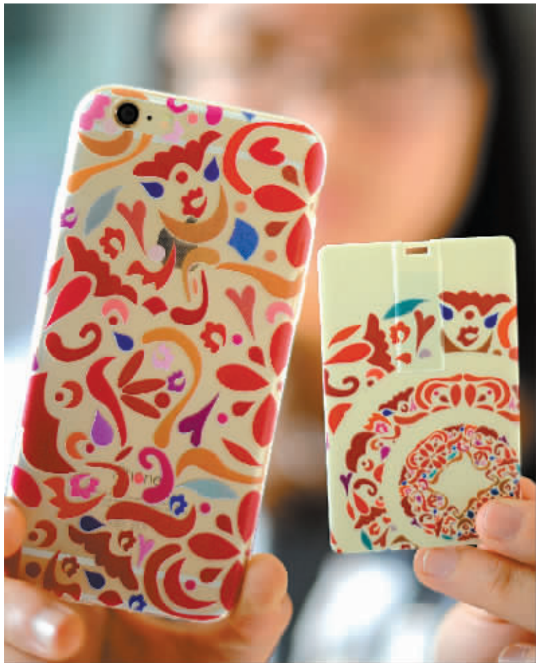
手机是电子证据的重要来源。(图文无关)

如今,电子证据在我国司法领域已不是“新鲜事物”了。早在1999年的《合同法》,2004年的《电子签名法》中已经有所体现。2010年,最高人民法院、最高人民检察院等联合发布的《关于办理死刑案件审查判断证据若干问题的规定》,第一次将电子邮件、电子数据交换、网上聊