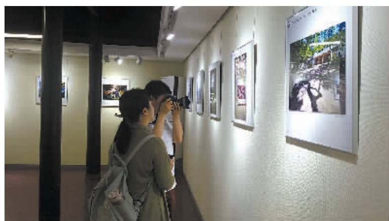
图为展览现场。

感慨地说:“我们的老祖宗在几百年、上千年前就能造出工艺这么繁复、精密的建筑,很伟大!摄影家