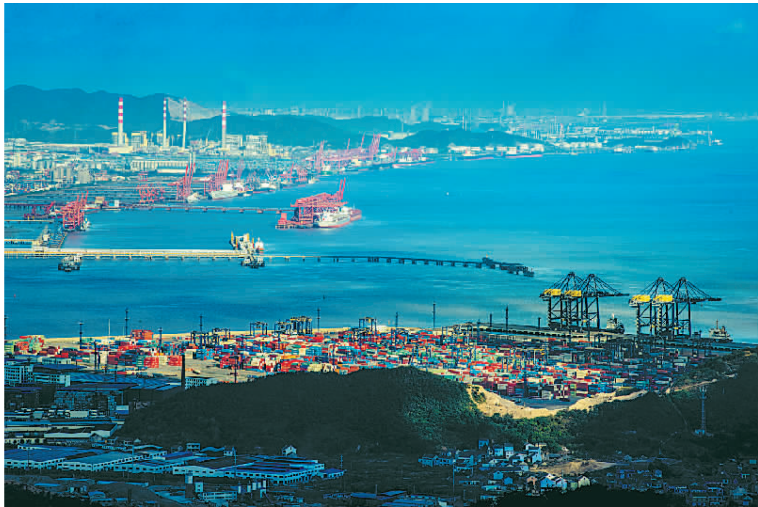
图为北仑港区

紧紧依托体制机制先优优势和沿海临港区位优势，北仑以项目驱动，培育战略性新兴产业，将优势做强。今年1至4月，全区装备制造