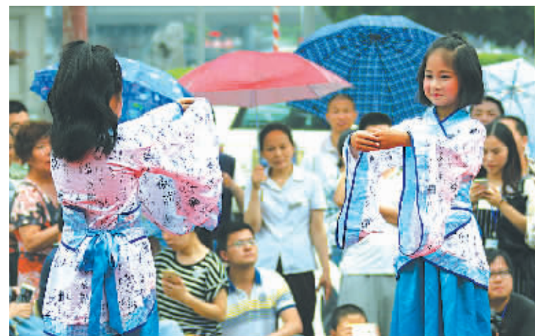
昨天是我国第11个“文化遗产日”。由市文化广电新闻出版局主办的“丝海·梦”百名少儿汉服实景表演在庆安会馆内及安澜会馆外广场举行,让孩子们了解宁波海上丝绸之路的历史,感受海丝文化的精髓。图为身穿汉服的小学生进行礼仪表演。