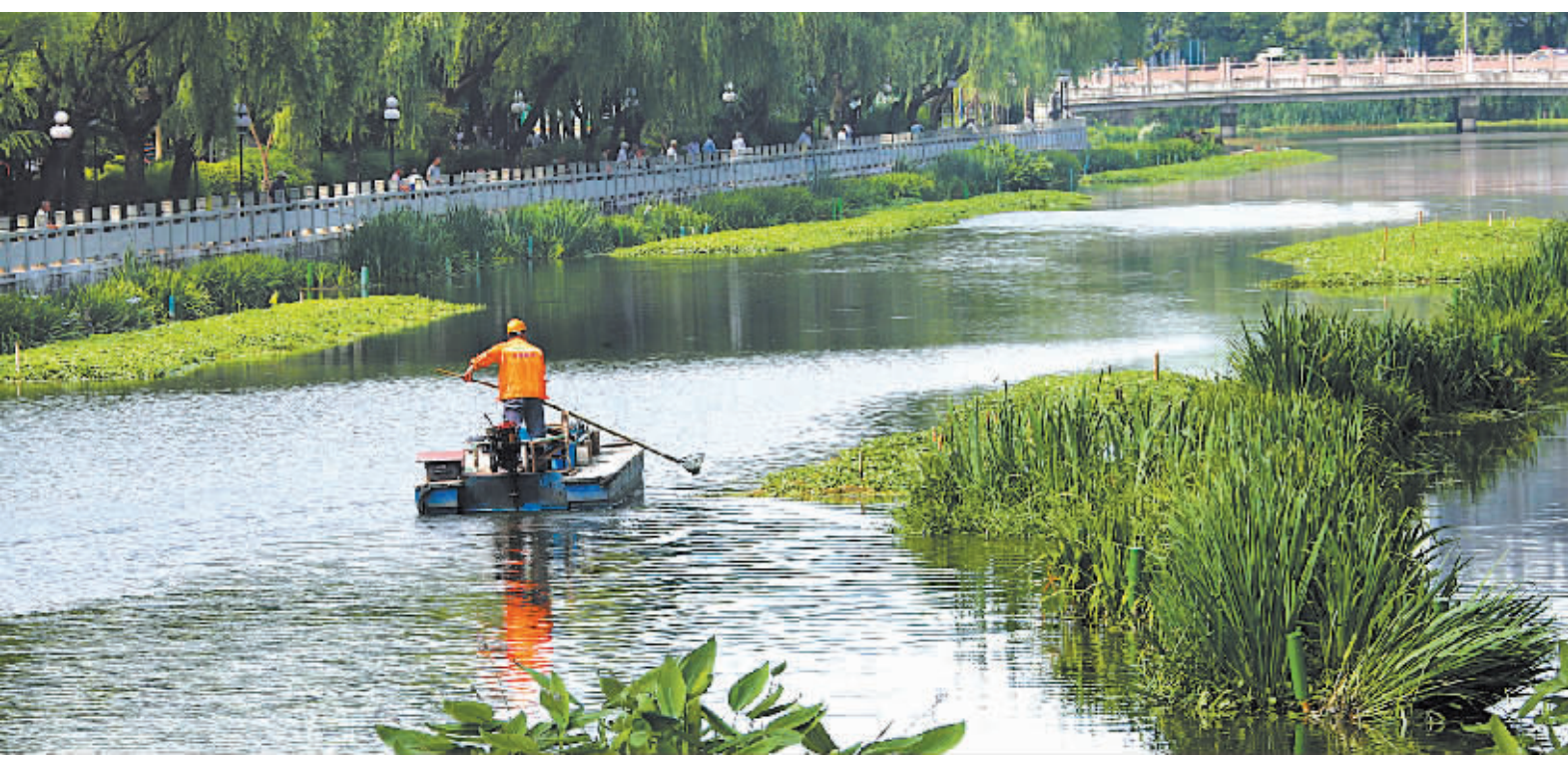
近期,保洁员增加巡查打捞频次,打捞北斗河上的漂浮物。