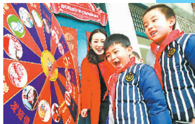
学科游戏嘉年华替代期末考试。