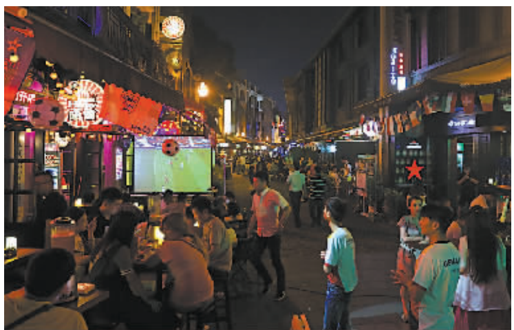
球迷正在酒吧观看球赛。

前天晚上9时，老外滩的沿江步道上流光溢彩，人流如织。吹着江风，悠闲散步，市民和游客很是惬意。而在另一边的酒吧一条街，更是热闹非凡。