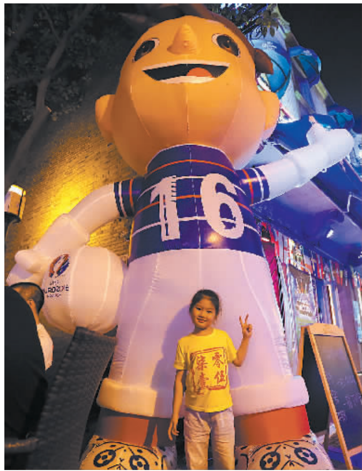
小球迷在和吉祥物合影。