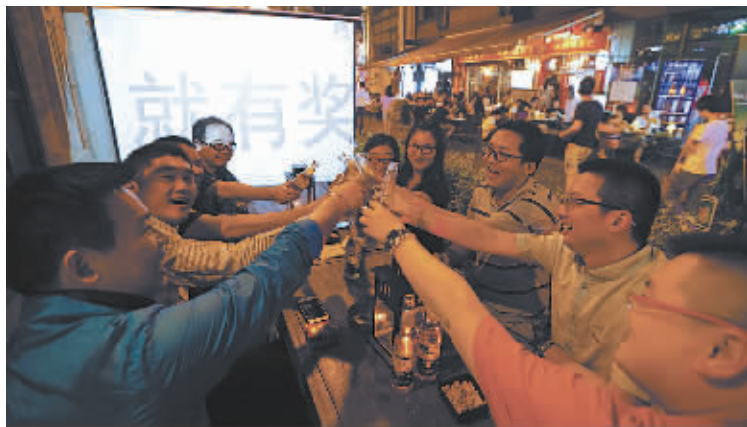
比赛中场休息期间，球迷举杯喝酒。