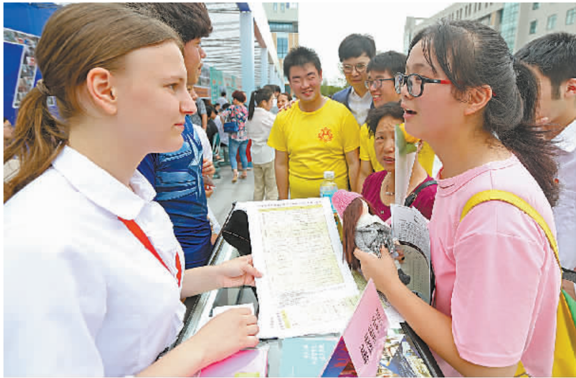
昨天,2016年中心城区职业学校招生咨询会在甬江职高翠柏校区举行,中心城区9所职业学校、技工学校集中搭台提供志愿填报服务。图为学生和家正在甬江职高韩国留学班展位前咨询。

昨天一块大大的展板树立在咨询会现场,上面写着“中职生同样能够考进全国重点大学!”这块展板是甬江职高立的。据该校的一位