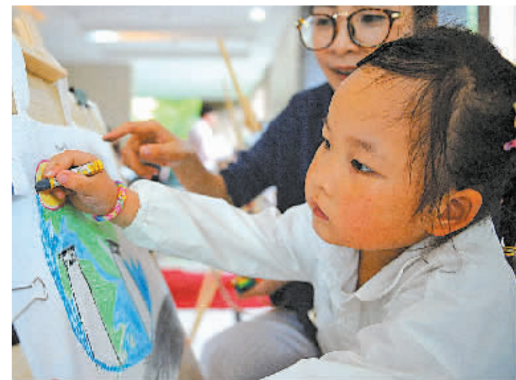
昨天,鄞州首南街道学府社区举行“环保袋上画环保”活动,少年儿童在空白购物袋上画环保宣传画,并把画好的购物袋赠送给周边居民,倡导绿色生活。