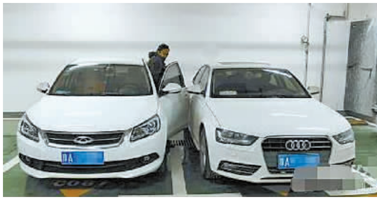
两辆车停一起，开门下车难。