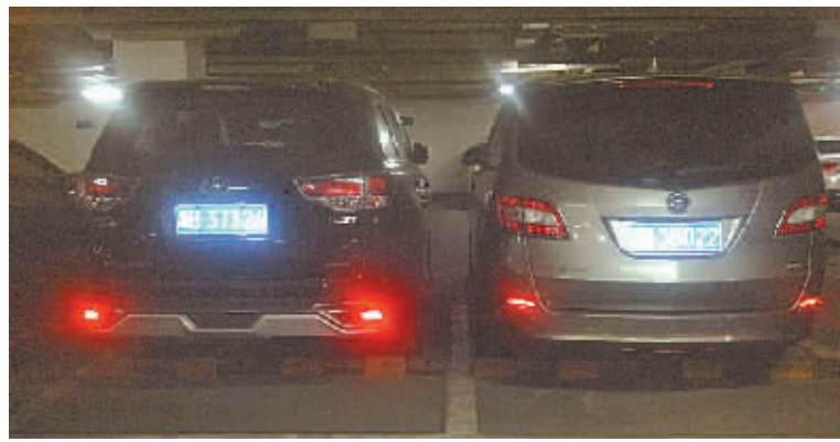
江北外滩花园两辆紧靠挤在一起的车子。

轿车时，停车应该是件很轻松的事情。但遗憾的是，眼下，越来越多市民买车的目标变了。20万以上的B级轿车已成为宁波家庭的重要选择。