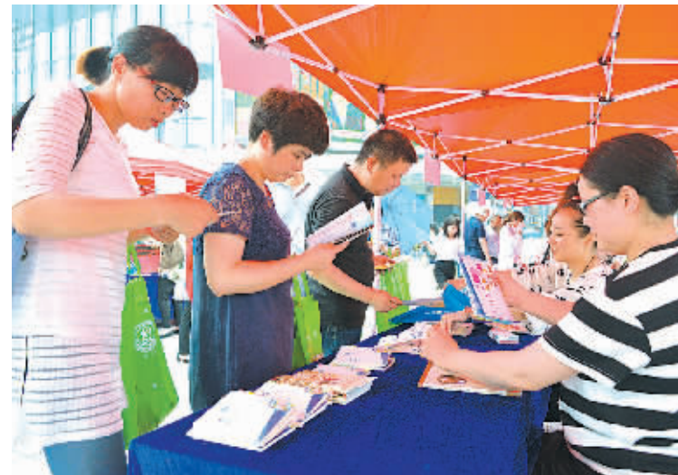
昨天上午,宁波创建国家食品安全城市广场宣传活动举行。本次活动以“尚德守法,共治共享食品安全”为主题,旨在推进宁波创建国家、省级食品安全城市工作,进一步提升我市食品安全保障水平。图为活动现场一角。