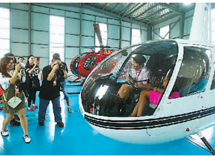
浙江首个直升机5S店落户北仑梅山。

近年来，智能化日益成为家电产品最耀眼的“商标”。一款空调扇集智能滑盖、智能开关、智能显示、智能温控于一身；一台干衣柜体积小如冰箱，一台洗衣机能对废水进行回收处理……宁波慈溪家电在打出“智能”牌后，让慈溪家电企业找到了与国内外家电巨头竞争的“杀手锏”，一批企业借助“芯”工程展翅腾飞。