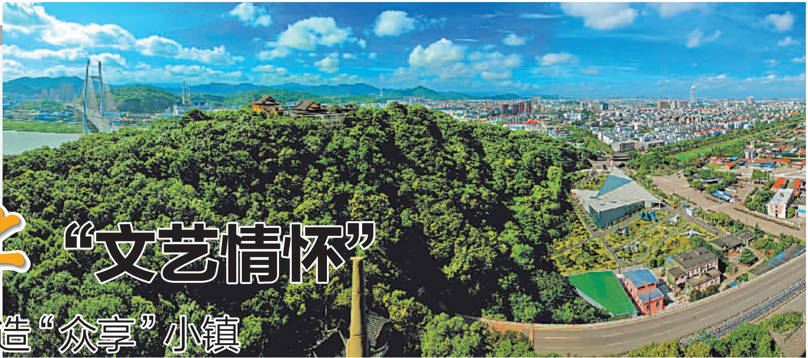
招宝山街道航拍图。

为深化、提升文化品牌、形象品牌、特色产业品牌,重聚人气,闯出一条转型发展之路,招宝山街道以打造“众享”小镇为目标,增添滨海旅游魅力,向人们呈现山海之间一个有韵味的江南小城,推进经济社会良性发展。