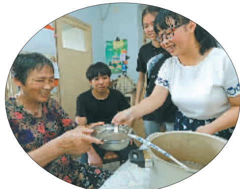
史家社区大学生党员给空巢老人送绿豆汤。

家住江东区东郊街道海悦社区飞虹苑小区的居民驾车进出小区时再也不用像以前那样提心吊胆了。此前,由于小区大门紧邻道路两侧时常停满车辆,驾车进出视线受阻,引发过几起交通事故,居民反应强烈。在海悦社区党支部的牵头下,社区干部多次与有关部门协调,在小区门口安装了交通隔离栏,解决了居民的“心病”。