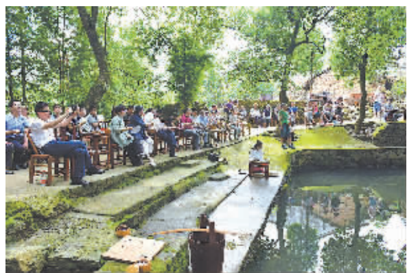
村民对乡村复兴充满期待。

特点都吸引着他们。南联四面青山环绕,南靠英雄水库,自然风光旖旎,环境清幽,更特别之处在于,南联是一个“活的村子”。“南联村还住着许多原住民,保留着传统的生活方式,这种原汁原味特别吸引人,我们更看重的是老房子里的村民和老房子蕴含的文化。”