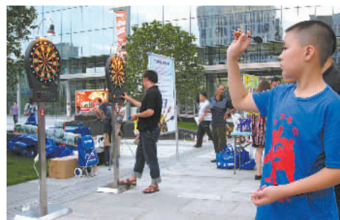
图为飞镖趣味赛活动现场。

本报讯(记者姬联锋)由宁波市体育总会主办,各级市级体育类民办非企业俱乐部承办的体育嘉年华活动昨天晚上在市文化广场保利剧院小广场举行,活动内容包括节目展演、趣味游戏、挑战活动等。