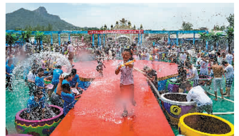
昨天上午,游客正在象山影视城大理皇宫景点享受泼水狂欢。

本报讯(记者南华 通讯员陈晓桦 吴宙洋)昨日,象山影视城大理皇宫里一下“长出了”许多棕榈和芭蕉,让人仿佛走进了热带雨林;人行其中,只见雨帘、雨丝扑面而来,彩色的大水缸清波荡漾,好一派清凉舒畅;象山影视城“湿透全身 幸福一生”第三届泼水节就在这拉开帷幕。 本届泼水节从7月2日持续到9月6日,分别有“开天泼地”“咱们穿越吧”“毕业·致青春”“泼水奥运会”“G20·象山行”等主题活动。在人人山人海与影视明星邂逅,也是泼水节的一项重头戏。