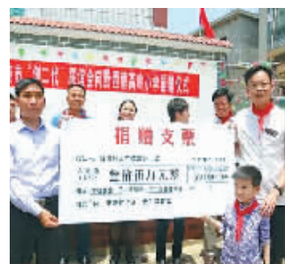
市“创二代”联谊会日前向贵州黔东南高岭小学捐款。(吴俊)