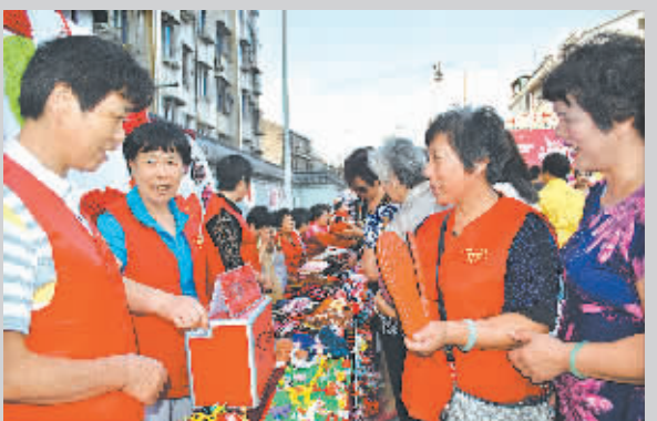
“爱心集市”上手工作品爱心摊。