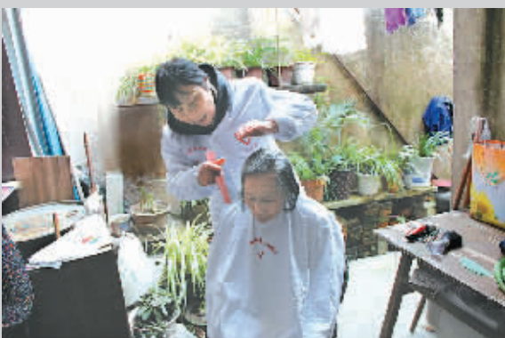
香香心理服务队上门为老人理发。