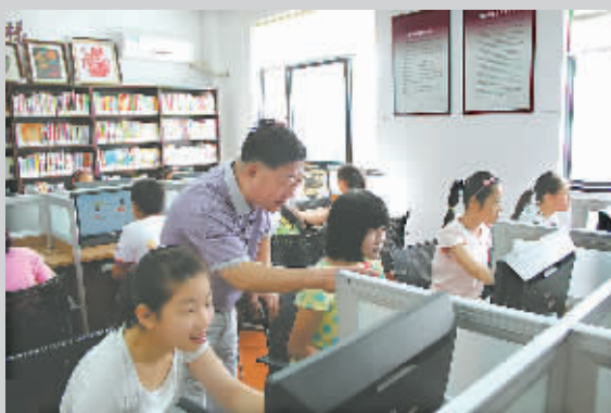
“双阳”绿色网吧指导青少年上网。

魅力红联，处处充盈着生动与浓情：社会组织、社区志愿服务，相互支持，渗透融合。目前，红联社区管理协调56个社区社会组织有序开展活动与服务，以社区党总支为花蕊，56个社会组织为花瓣的“金葵花开”发展模式逐步形成，2000余名志愿者共同描绘出和谐共荣的多彩画卷。