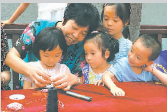
巧手阿姨工作室教小朋友做端午香粽。