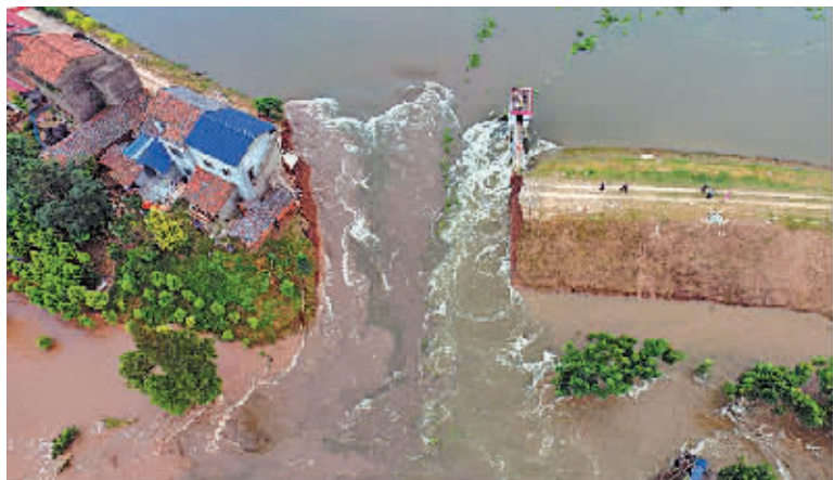
这是7月10日拍摄的湖南华容县新华垸溃口现场。

据新华社长沙7月10日电 (记者周楠 白田田) 记者14日从湖南省防汛抗旱指挥部和华容县综合了解到,10日10时57分华容县新华垸溃口。截至10日15时,已转移人员1万余人,加固垸内4