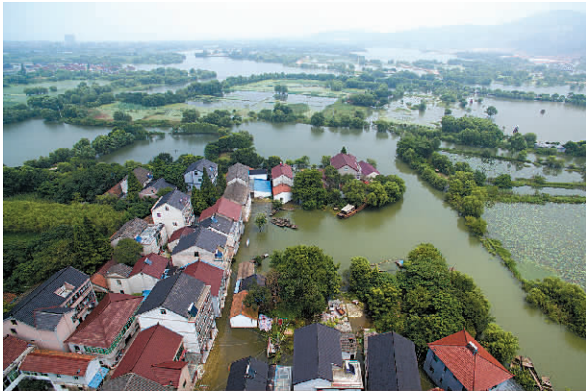
7月11日航拍的浙江长兴县太湖图影旅游度假区大荡漾村水荡自然村，太湖高水位导致村中内涝不退。受太湖高水位影响，从7月1日至11日12时，浙江湖州市受灾范围涉及15个乡镇（街道），受灾人口1.5474万人，全市尚无人人员伤亡报告。全市农作物受灾面积6.51万亩，成灾面积1.13万亩。

经历入梅以来多轮强降雨和“尼伯特”台风袭击后，长江流域受灾区域眼下正雨过天晴，强降雨灾情导致一些地区菜价上涨、车辆被淹、田间绝收、地质灾害高发、疫情隐患多。有关专家提醒广大民众，今年主汛期全国降水总体偏多，可能有强台风登陆我国并深入内陆；基层镇村要针对地质灾害隐患点做好观测、预警、预报，一旦发现隐患险情加剧立即组织群众转移；“泡过水”的环境中大量病菌等污染物，容易让人腹泻或患上皮肤病，应尽快消毒杀菌。