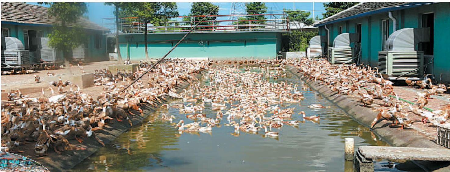
养在“泳池”里的麻鸭。

在镇海,水禽“离河养殖”模式推行已一年有余,成效明显。鸭鹅不下河,到底该怎么养?记者带着好奇,一探究竟。