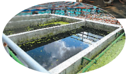
“江南”公司的污水处理池。