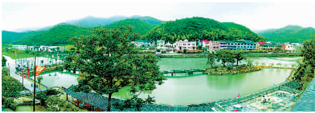
碧水涟涟的双林村。

走在村道上,人来车往,很是热闹,而道路却十分整洁,穿村而过的汶溪清澈见底,除了偶有几片飘落的树叶,溪边、水面几乎看不到其他垃圾。紧挨村道的是幢幢漂亮的楼房,庭院里花草树木错落有致。正因如此,双林这个小山村每年吸引着数十万人前来