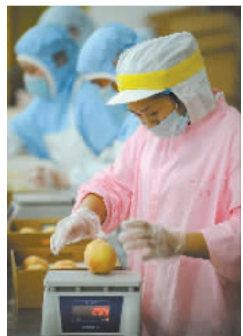
此次单果重量标准起重为225克,并对桃子的外形、糖度、成熟度都有严格要求。