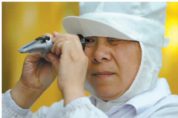
一名检验员正在进行桃子糖度测试。