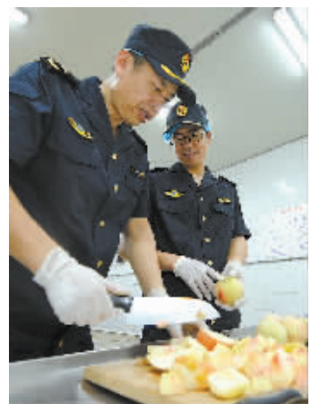
奉化出入境检验检疫局工作人员现场进行有害生物检测。