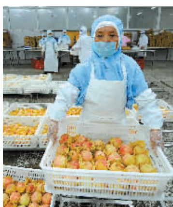
在加工车间,桃子要经过短暂的冷风降温处理。