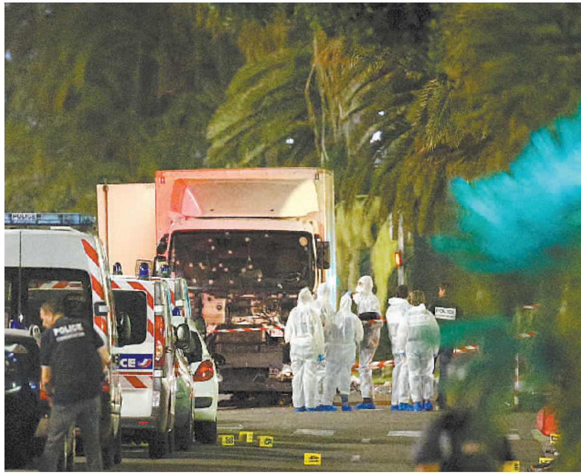
7月15日，在法国南部旅游城市尼斯，法国警察和法医在袭击现场工作。

据中国驻马赛总领馆15日确认，两名中国公民在法国尼斯市14日晚发生的卡车冲撞人群事件中受伤。