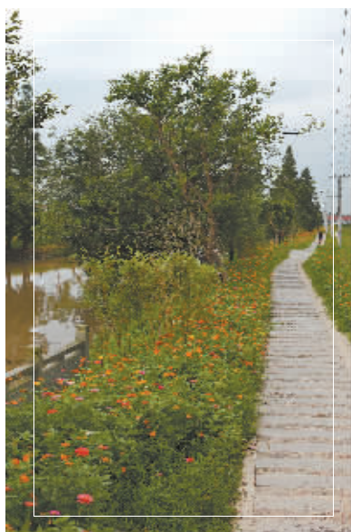
临河田埂路改建为游步道。