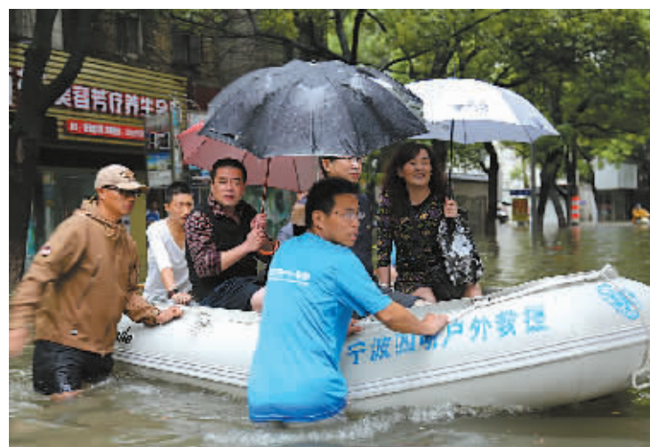
“菲特”台风期间，四明户外应急救援队的青年志愿者在转移群众。

如今，青年中医专家义诊、摄影名家为居民拍摄“全家福”、书法名家派送“福”字等青年“文化惠民”活动在西门街道司空见惯。欧阳媛斐告诉记者：“街道团工委相继搭建了‘福送百家、公益筑爱、私人文化定制’三大文化惠民服务平台，引领来自街道内外的青年以送文化、筑爱心、品文化等方式‘以文惠民’，‘青年文化惠民’已成为西门街道响当当的公益服务品牌。”