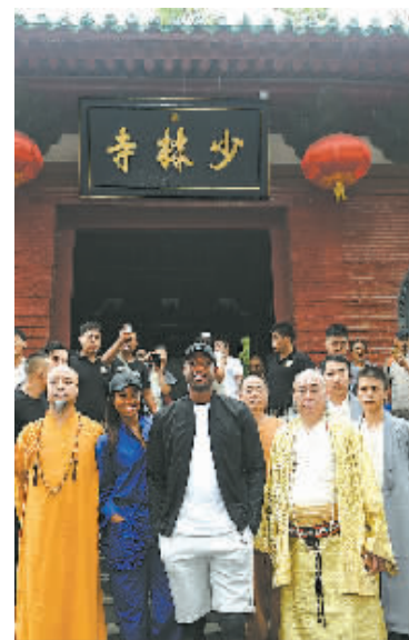
7月19日，韦德(前排右二)在少林寺景区内与陪同者合影留念。

NBA总冠军的韦德离开他效力了13年的迈阿密热火队，转投自己的家乡球队芝加哥公牛队。