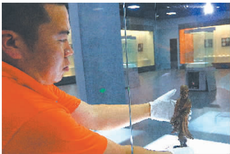
上图为工作人员正在布展。右上图为郑小西牙石刻赵孟頫《仙山楼阁图》插牌(清)。右下图为汉猪形玉握。(周建平 摄)

展品中历史最悠久的一件西汉时的猪形黄玉握。玉握是古代有身份的死者手中握着的器物。古人认为人死时不能空手而归，要握着财富和权力，而猪象征着财富。据说这是汉代最流行的葬品。这件玉