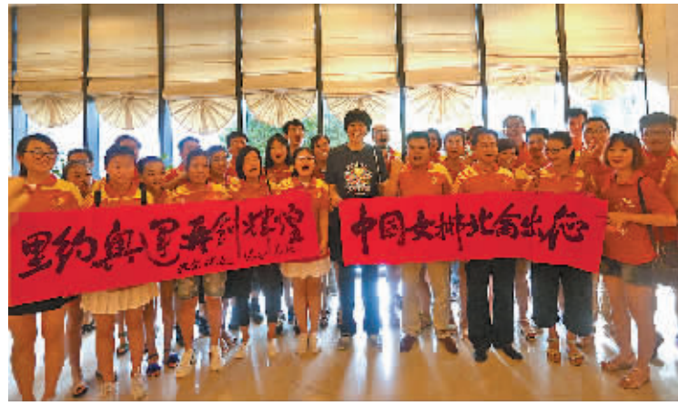
图为中国女排离开北仑基地现场。

本报(索向鲁 郑亮 金旭孟)7月24日，中国女排结束了在浙江宁波北仑为期半个月的集训后，在主教练郎平的带领下启程前往北京，作出征前的最后准备。中国女排是7月8日抵达北仑集训的。7月30日，中国女排将从北京出发，前往巴西参加里约奥运会。许多北仑球迷协会的球迷自发前往北仑体育训练基地欢送中国女排，并送上一幅“中国女排北仑出征，里约奥运再创辉煌”的书法作品。