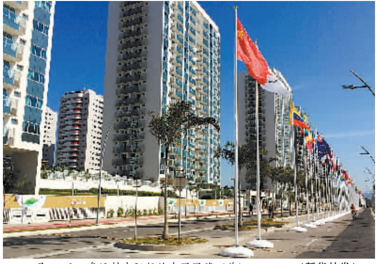
7月24日，奥运村中飘扬的中国国旗（前）。（新华社发）

已经入住的美国和英国代表团表示，在奥运开幕前对奥运村进行最后改善是很正常的。中国代表团相关成员也认为，由于奥运村是全新建，肯定会有些问题，各方面需要慢慢磨合。