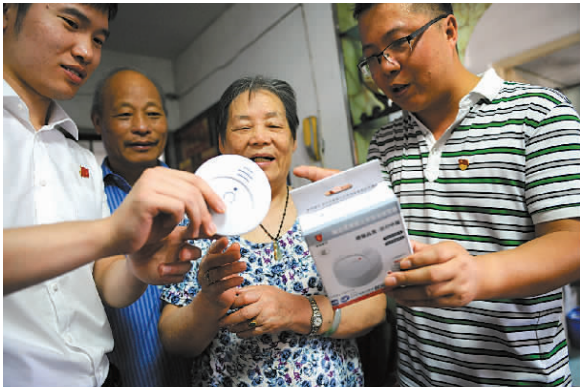
近日，江东东胜街道成家社区的党员志愿者来到独居和空巢老人家里，无偿提供和安装火灾报警设备，帮助老人安全度夏。