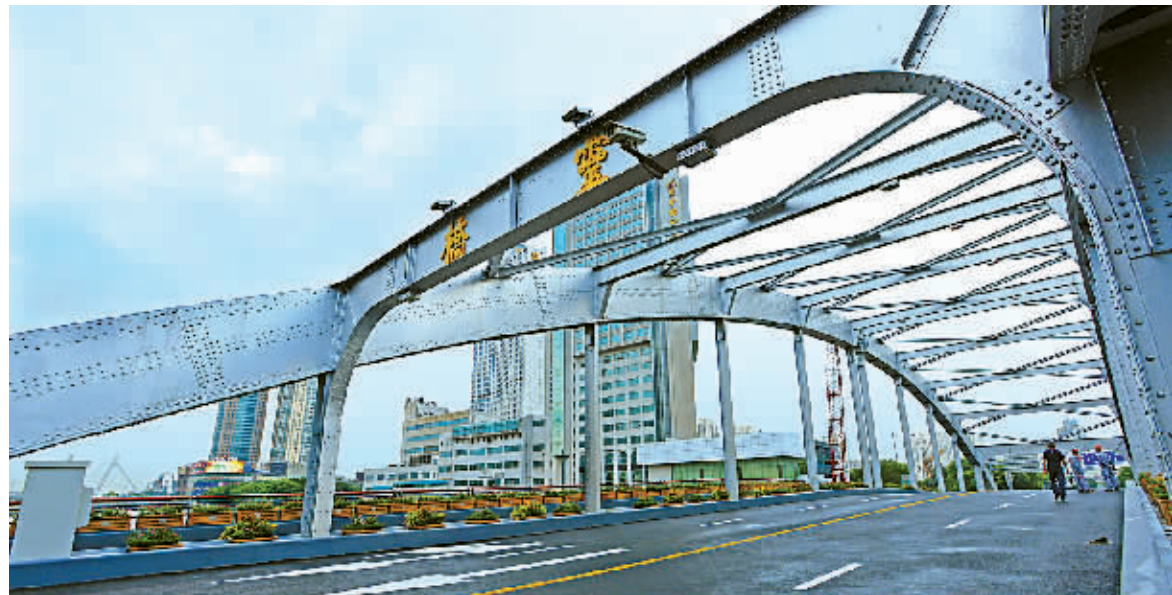
昨天,有关部门为灵桥恢复通行做扫尾工作。

新中国成立后,灵桥经过三次大修,上一次大修是在1994年,将桥面拓宽了6米,增加慢车道功能。2011年11月,在遭到一艘打桩船的猛烈撞击后,已过70年设计年限的灵桥被诊断为危桥。考虑到灵桥对宁波的历史文化价值,我市于2012年决定对灵