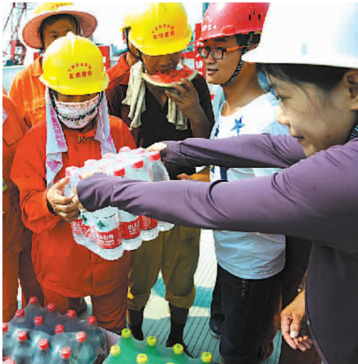
昨天,江东白鹤街道丹凤社区志愿者来到轨道交通3号线儿童公园站工地,向在高温下施工的技术人员和工人送上矿泉水、西瓜、毛巾等。