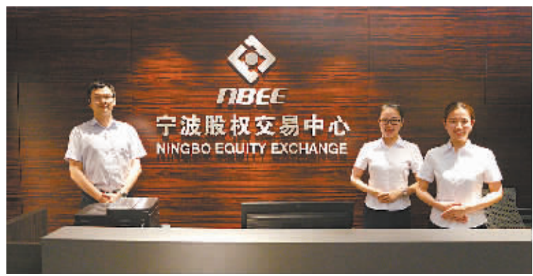
甬版OTC今日扬帆远航。

我市将进一步加快构建宁波股交中心市场体系:对于具备实施股份制改造条件的有限公司,将引导其进行改制;对于创业项目,鼓励其新设股份(有限)公司;