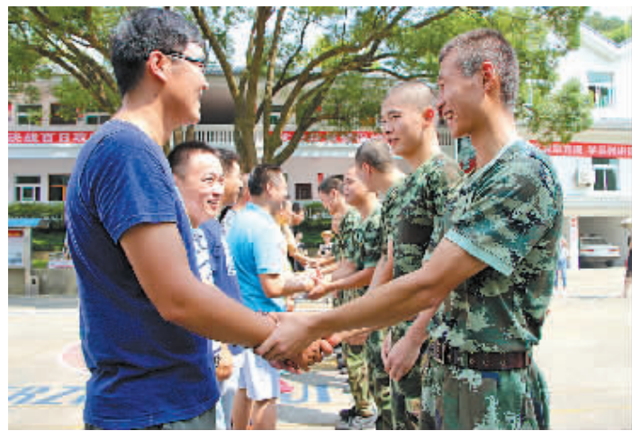
前握手。图为机动二中队官兵与退伍老兵拔河赛。

本报讯(记者王博 通讯员徐超 翁明勇)7月30日上午,80余位从部队复员的老兵、退伍转业回原籍的干部与浙江宁波边防支队机动二中队官兵重聚军营,一起开展了“那些年,我们在部队的日子”主题活动共庆“八一”。 其间,老兵和老干部们观看了二