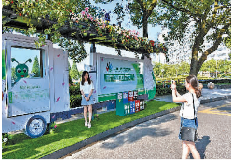
新颖的户外广告成为一道靓丽的城市风景线。

UME影城、东方神画等品牌的造型时尚的广告时不时出现在江夏公园、灵桥西、东门口等客流较多的公交站亭里。“目前,宁波户外广告创新多集中在构建型领域,产品正在向立体化、多形式转型。”业内人士介绍,随着技术的进步,奇幻光影秀、可平视路面、360°立体候车亭等新的形式会越来越多。 今年以来,海曙区以“三改一拆”、户外违规广告整治等为契机,引导传统广告业转型。其中户外广告坚决抛弃硬广告形式,推出以场景式为中心,多入口、多感官的体验式、互动式广告。海曙区政府还推出各类扶持奖励措施,对广告业进行单列支说明,鼓励广告企业将创意与技术相结合。“德