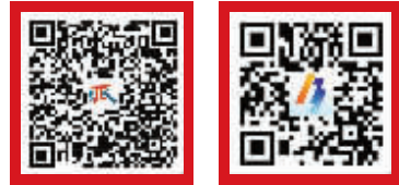
雨派新闻客户端 中国宁波网手机版