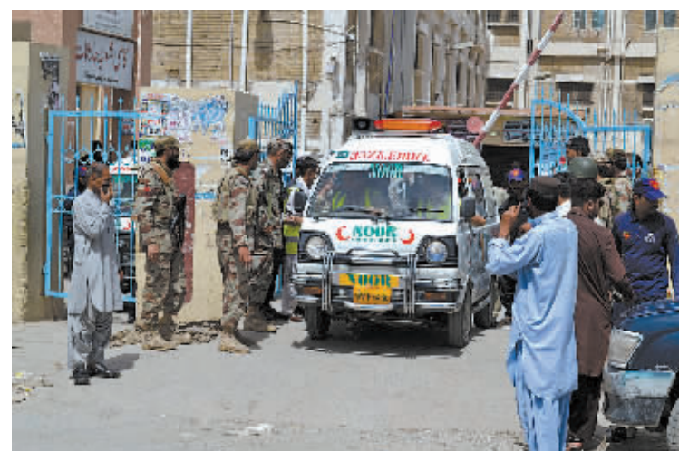
8月8日，在巴基斯坦奎达，救护车运送伤者离开自杀式炸弹袭击现场。

新华社伊斯兰堡8月8日电（记者季伟 张琪）据巴基斯坦官方和媒体8日消息，当天上午发生在该国俾路支省首府奎达一家医院的炸弹袭击事件已造成至少70人死亡，另有112人受伤。此前当地媒体曾报道说有93人在袭击中死亡。