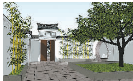
百年老宅修复效果图