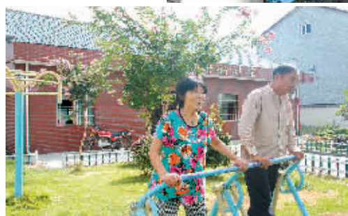
西街村村民在健身