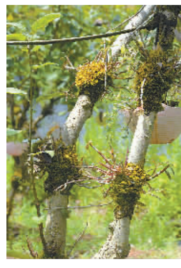
铁皮石斛在梨树上扎根落户

“之前,我们经过小范围试种和检测,发现在同一地区,模拟仿野生环境栽培的铁皮石斛,多糖含量和部分微量元素比大棚里种出来的更高。”他预计,在采摘周期内,每亩