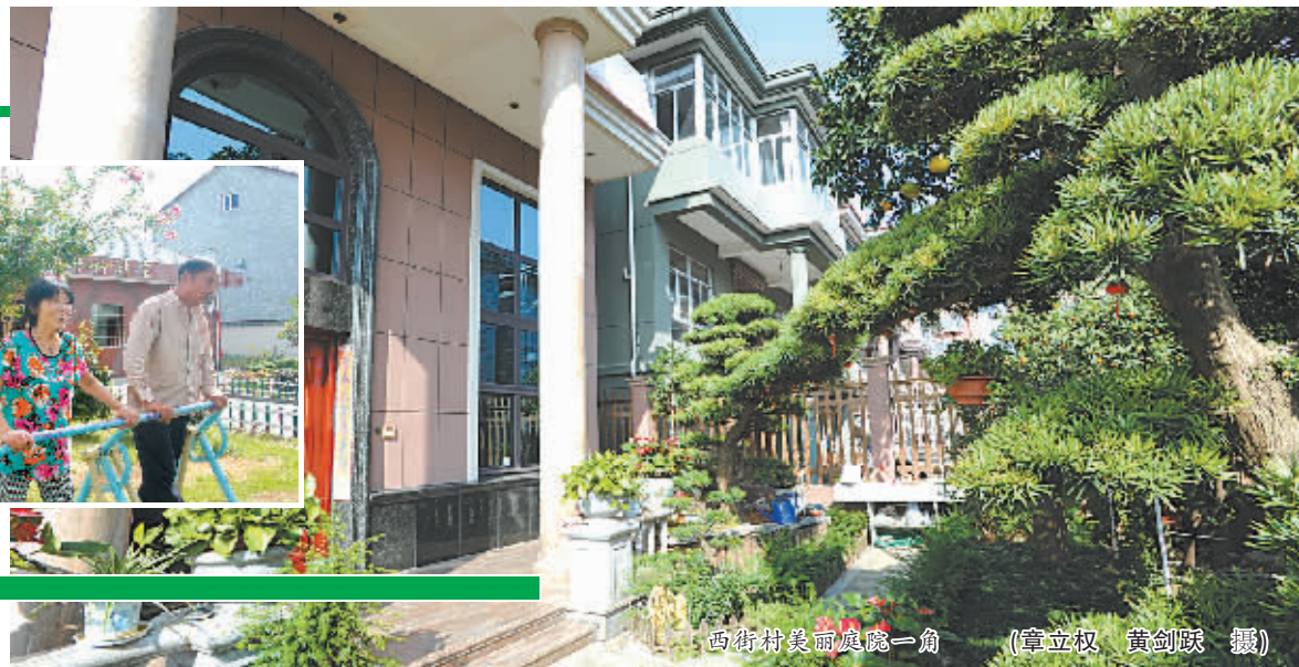
西街村美丽庭院一角

干净整洁的道路通到家家户户,幽雅静谧的农家小院傍水而建,房前屋后是四季常青的桂花树、文旦树,围成篱笆的茶梅开着朵朵红花……在姚西长冷江畔,余姚阳明街道西街村脱胎换骨般变化,不仅让每一位村民享受到舒适的居住环境,也让每一个到村里来参观的人赞叹不已。