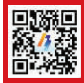
中国宁波网手机版

天气:今天多云,局部有阵雨或雷雨;偏东风3级;34℃-26℃ 明天多云;偏东风3级 今日市区空气质量预测:良