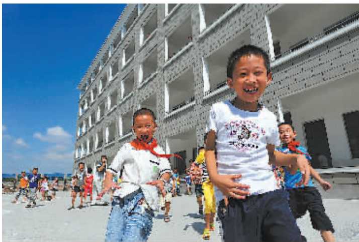
外来务工人员随迁子女搬进新校舍，同享一片蓝天。

“种教”首站大堰学校就带徒6人，传授经验，其中一位徒弟通过高级教师评审。2年里，薄弱学校师资力量得到显著提升，全市农村学校高级教师通过率每年提升5个百分点。早在2006年，江东区就开始探索建立了区域内教师有序流动制度，2014年率先在全市实现教师校长交流人事关系随迁交流的全覆盖，扫除了“校籍”障碍，优化各教师队伍结构，盘活江东教育一盘棋。五年来，全区新增省级特级教师6名，市级以上名师和学科骨干22名，区级名师和学科骨干154名，实现区域教育“造峰抬谷”。