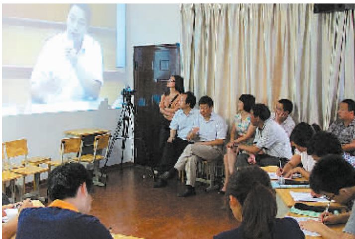
山村教师隔着大山与名师“零距离”交流。

显增加。不少本地户籍学生开始回流和插班，更多的本地孩子在幼升小和小升初时选择留下。据了解，该县已有58名城区学校中层以上干部到农村学校担任校长，39人完成交流。而鄞州区校长交流人数逐年增加，至今累计已有120人。校长交流让能干事会干事的校长，交流到更重要的岗位上任职，激发他们创新热情和办学活动，从而推动了区域内教育均衡发展。