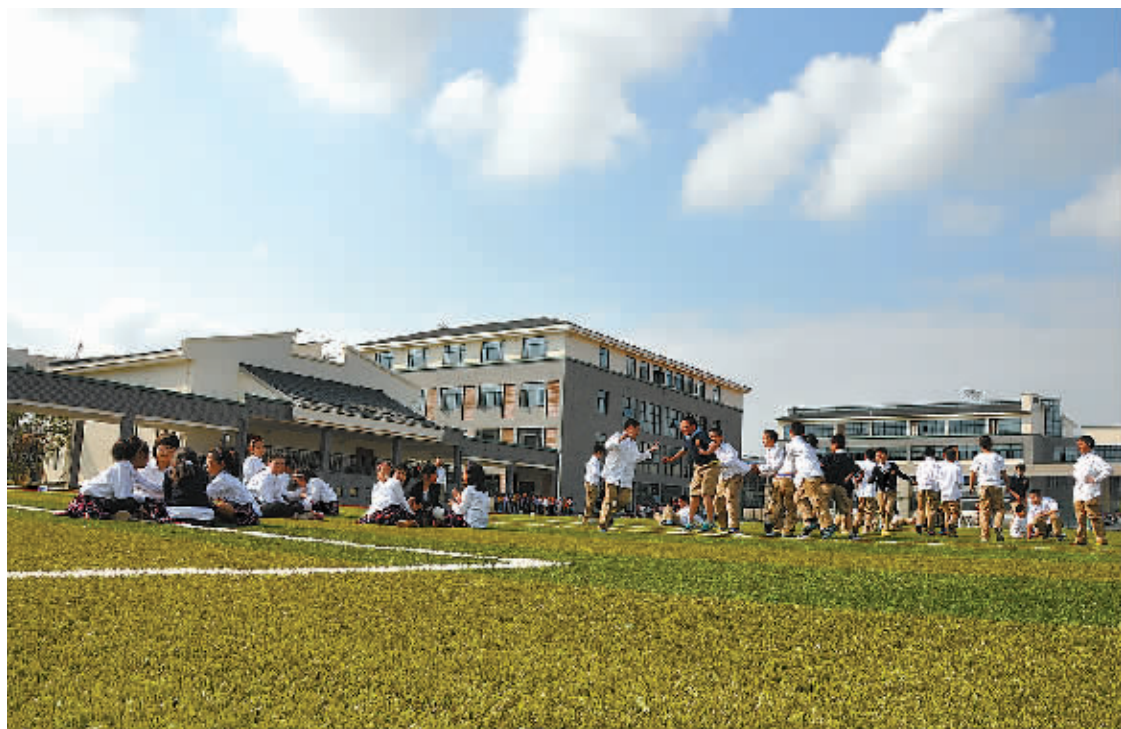
5年新建中小学93所，义务教育标准化学校达标率超过95%。

教育是民生之基，关系千家万户的福祉。眼下高价学区房、学区一表生爆棚在全国频频出现，真实而又生动地反映了群众对优质教育资源的渴求。怎样推进义务教育优质均衡发展，成为摆在各地政府面前的一道必答题。宁波以全面推进义务教育段教师、校长交流为抓手，打出一套“组合拳”，有效统筹城乡之间、区域之间和校际之间的教育资源配置，基本实现区域内义务教育均衡发展。