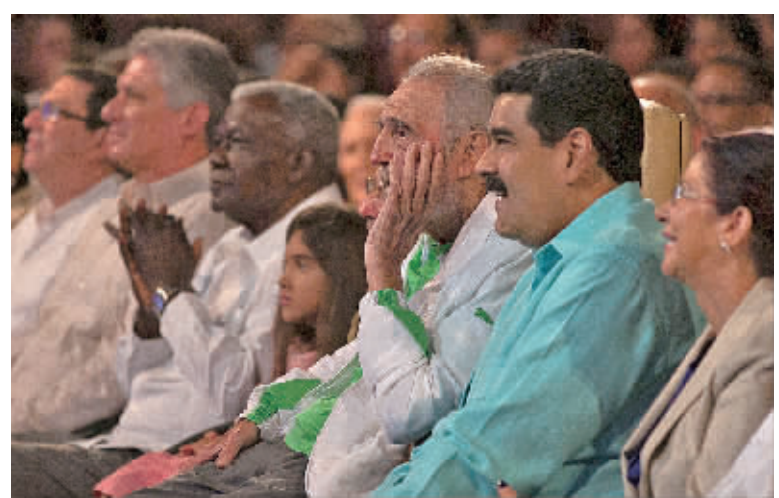
8月13日,在古巴首都哈瓦那,古巴革命领袖菲德尔·卡斯特罗(右三)及委内瑞拉总统马杜罗(右二)出席在卡尔·马克思剧院举办的庆祝活动。

2006年7月,卡斯特罗因肠胃出血接受手术,把权力暂时移交给弟弟劳尔,并于2008年2月宣布正式辞去国务委员会主