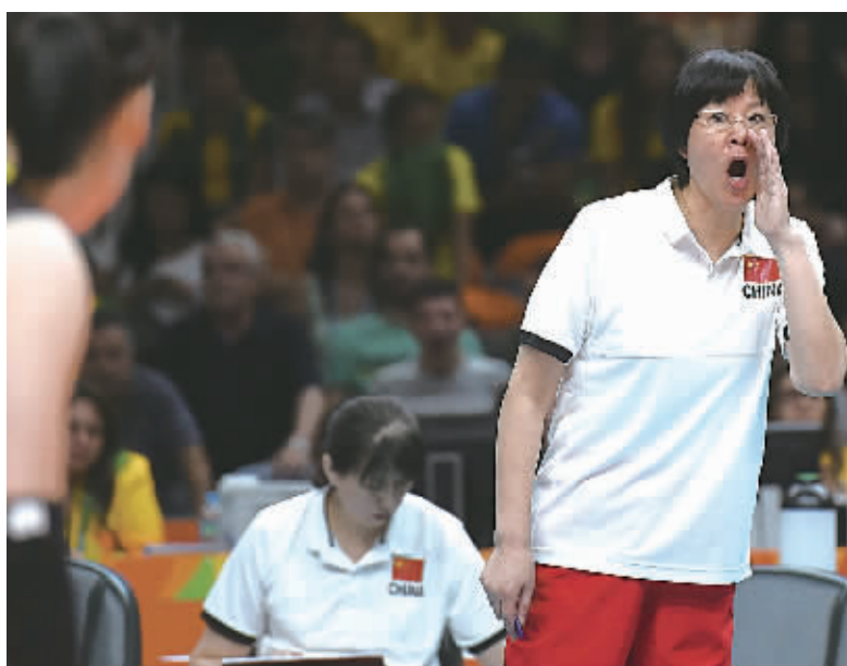
8月16日,中国队主教练郎平(右)在场边指挥。

新华社里约热内卢8月16日电(记者徐征 王镜宇)在首场小组赛负于荷兰之后,无论是教练、球员还是球迷,都在等待,等待着年轻的中国女排找回自己应有的状态,而这一等就是五场比赛加一局的时间。