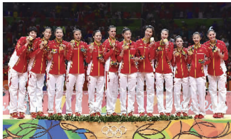
在2016年里约奥运会女子排球决赛中,中国队夺得冠军。

体育产业作为新兴的绿色产业,正成为推动我市经济社会持续发展的重要力量。我市积极谋划、创新举措、主动作为,使体育在民生领域、社会管理和经济产业当中发挥越来越大的作用。