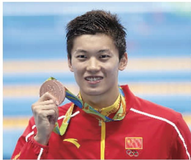
汪顺在颁奖仪式结束后展示奖牌。