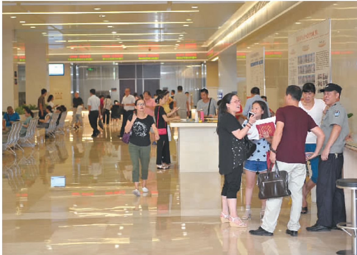
照像摄取的市行政服务中心办事大厅。