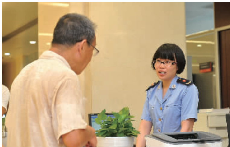
市民在市行政服务中心办理企业登记相关业务。

在吸引投资方面，房地产业回暖迹象明显，上半年新增注册资本53.41亿元，是去年同期的5.6倍。租赁和商务服务业、文化、体育和娱乐业、信息传输、软件和信息技术服务业同比增速分别高达110.5%、105.3%、84.6%。“数据表明以上行业正加速成长，新的经济增长点正在培育。”宁波市市场监督管理局企业监管处相关负责人说。