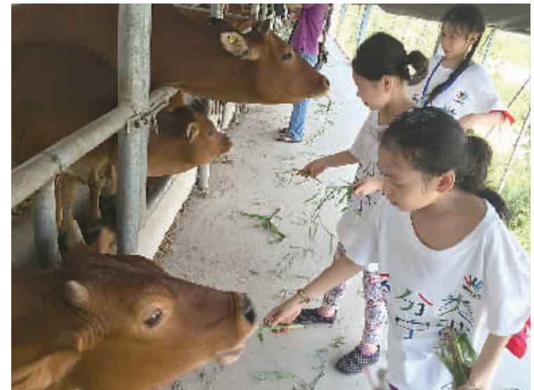
孩子们在喂牛吃草。

据介绍,农场本身是一个内循环系统非常完善的生态链,与垃圾源头减量和垃圾分类理念十分契合。“比如,农场里的杂草可以喂牛,牛粪可以利用微生物发酵分解滋养土壤,土壤可以种出更多的好菜,菜叶等厨余垃圾可以沤肥,最后又回归于土壤。”工作人员以农庄如何开展内循环为例给孩子们讲解垃圾分类重要性,同时通过种种游戏、实践活动,让孩子们掌握分类知识与技巧。