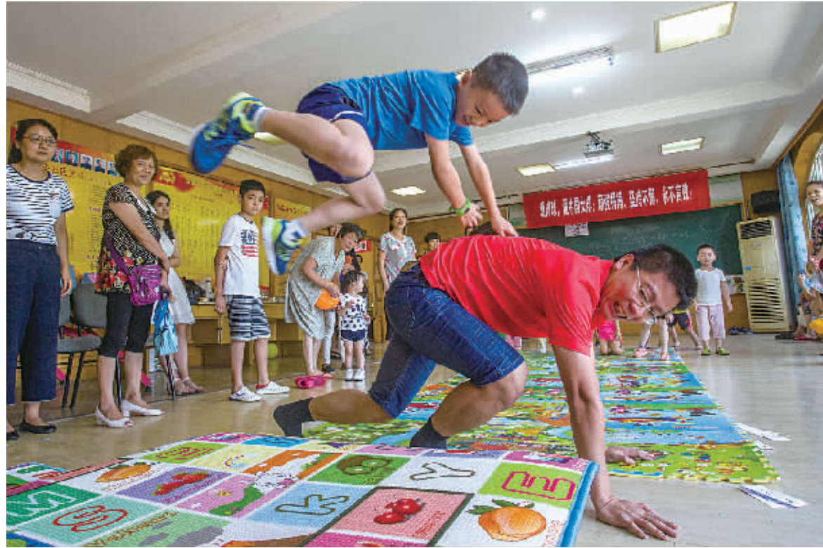
图为可可爸爸在陪孩子们玩。