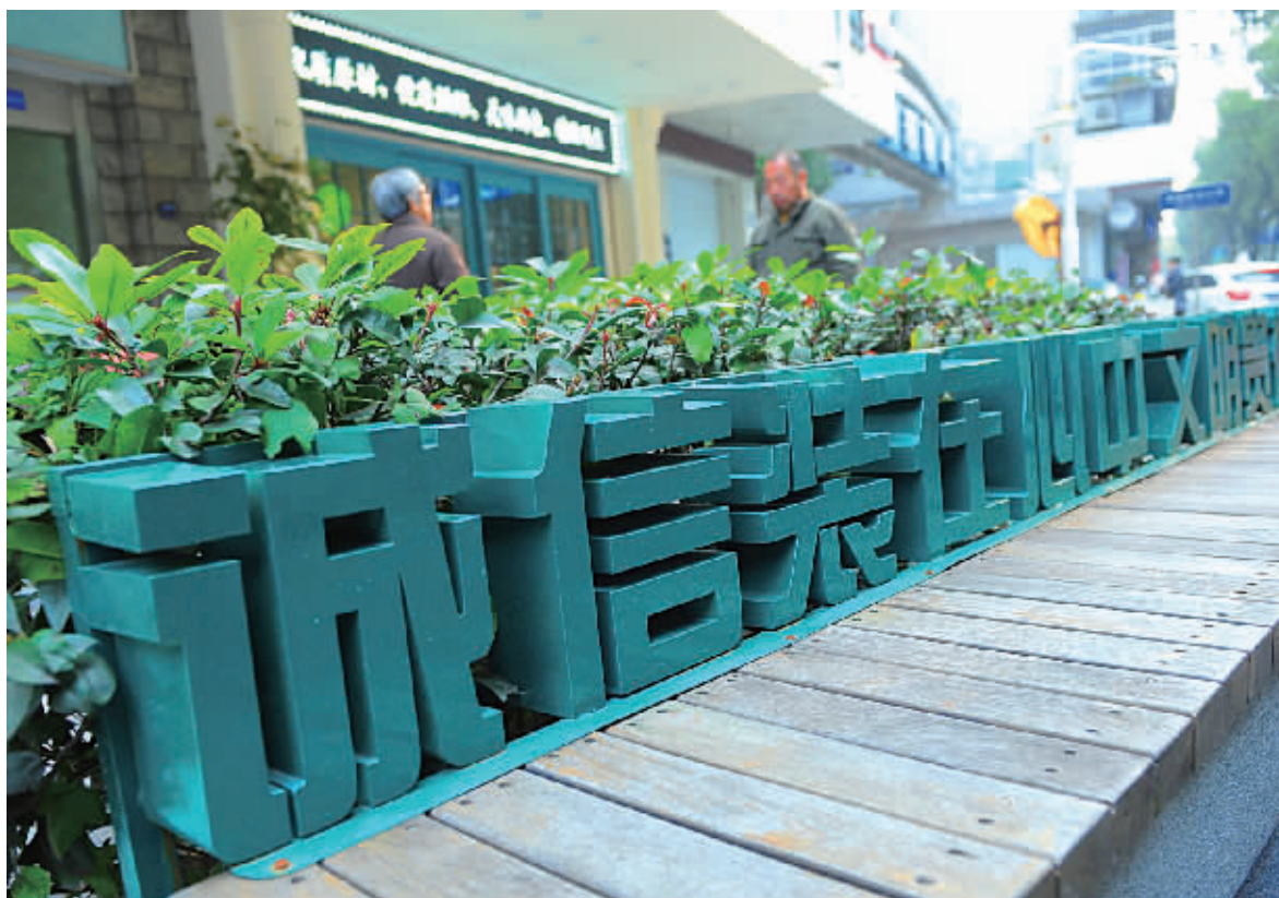
诚信宣传在宁波街头随处可见。(资料图片)

今年年初，市信用中心依托市信用平台建立了联合惩戒信用信息管理系统，实现了信息推送、执行反馈、异议处理等动态协同功能。税务部门率先通过平台向相关单位推送了包含32家重大税收违法案件当事人的黑名单。32家黑名单企业中，目前已有3家补缴了税款、滞纳金、罚款计1900多万元。