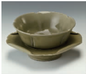
越窑青瓷荷叶带托茶盏