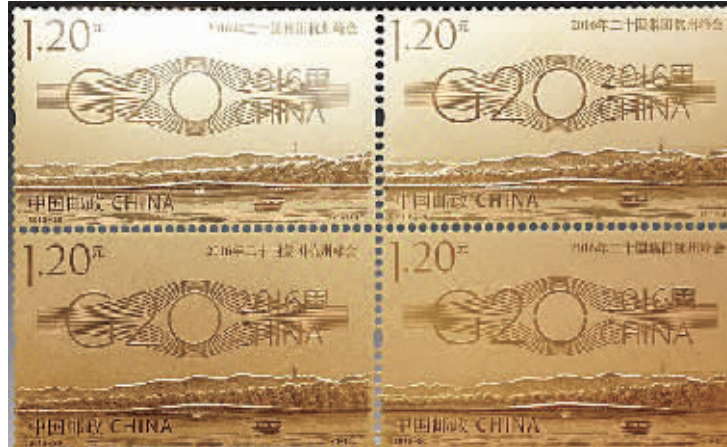
图为《2016年二十国集团杭州峰会》邮票金套装。

江地方元素。首发现场还将同步发行G20峰会首日封、纪念封、《G20》风采套装、《G20峰会 相约浙里》邮册、《G20二十国》明信片等邮品，并启用新邮纪念邮戳一枚。我市各集邮门市部即日起开始优惠预订《2016年二十国集团杭州峰会》邮票金套装及《G20丝绸版票金》套装，截至昨日18时，我市已有数万市民预订。