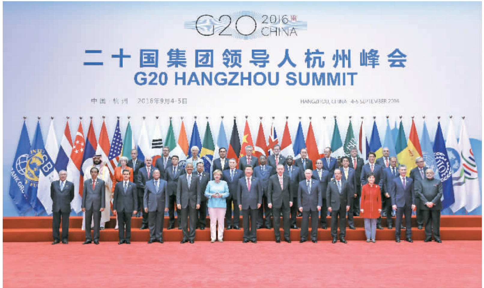
9月4日,二十国集团成员和嘉宾国领导人、有关国际组织负责人集体合影。

新华社杭州9月4日电 二十国集团领导人第十一次峰会4日在杭州国际博览中心举行。国家主席习近平主持会议并致开幕辞。习近平强调,面对当前挑战,二十国集团要与时俱进、知行合一、共建共享、同舟共济,为世界经济繁荣稳定把握好大方向,推动世界经济强劲、可持续、平衡、包容增长。