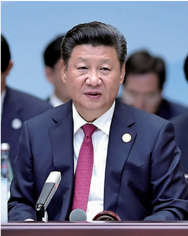
9月4日,国家主席习近平主持会议并致开幕辞。