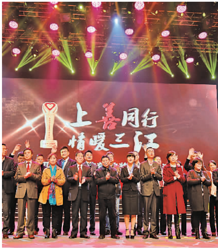
2015年宁波慈善奖颁奖晚会。

宁波人存善念、行善举的朴素意识得到了进一步激发。近5年间,全市慈善组织直接接收捐赠超过35.83亿元,慈善救助总支出约30.83亿元,受助人次数达294.29万。而“准入门槛”的降低,推动了社会组织的快速涌现,不断满足群众日益增长的多元化需求。截至今年9月1日,市本级通过直接登记的社会组织有62家,其中从事社会服务的公益组织有34家,超过50%。尤其是2016年,仅上半年就直接登记22家,其中行业协会商会类和公益慈善类几乎各占一半,与2015年全年登记数量接近持平。