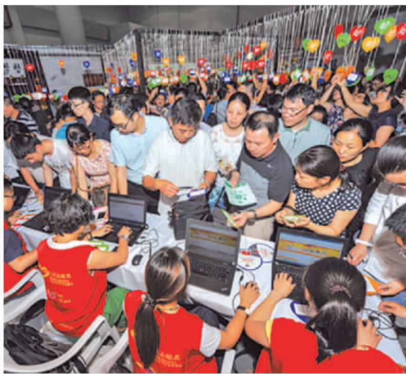
2015年,“三百对接”公益集市“微心愿”认领现场。