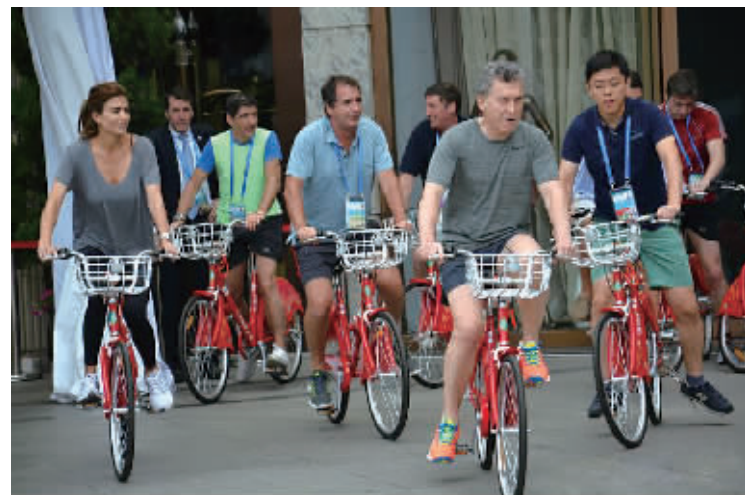
阿根廷总统和夫人骑“小红车”环游西湖。