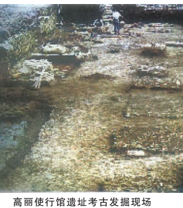
高丽使行馆遗址考古发掘现场

契机在于宋丽通使路线的改变。由于传统上经登州、莱州、密州的北方航线受到辽国掣肘,熙宁七年(1074)高丽遣使奏请“欲远契丹乞改途由明州诣阙”,得到宋廷许可,“自是(高丽)王徽、王运、王熙修职贡尤谨。朝廷遣使亦密,往来率道于明……明州始因供顿”(《宝庆四明志》)。两国交往,明州因困于供给呢?原来,作为宋朝设置市舶司(相当于海关)的几大口岸城市和沿海国门之一,明州不仅要管理外贸事务,还承担了部分外交职能。明州到宋都汴京(今开封)路途遥远,进出明州港的宋、丽使团的迎送、安置、款待、陪同等一应接待事务,都由明州政府出资承办;此外还负责筹备出使、持牒报信等事务。在“元丰法”