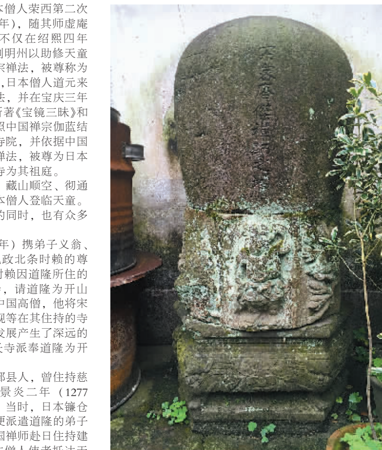
天童寺密庵成杰之塔。

在“海上丝绸之路”发展的历史中,佛教文化交流一直是其应有之义。而天童寺作为宁波重要的禅宗寺院之一,承担着佛教文化交流重任,它将具有中国特色的佛教宗派禅宗传播到日本,有力地推动了日本禅宗的发展,为海上丝绸之路添上了浓墨重彩的一笔。