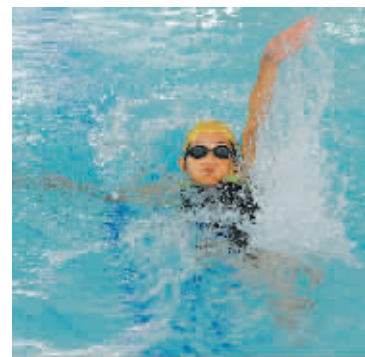
图为比赛现场。

本报讯 (记者姬联锋) 宁波市残疾人青少年游泳锦标赛昨天上午在江北区实验小学游泳馆举行,46名小运动员在40多个项目中进行了激烈的角逐,年龄最小的6周岁,最大的15周岁。来自省残疾人游泳队的领队和教练特意从杭州赶来观战,有一批好苗子被选进省队。