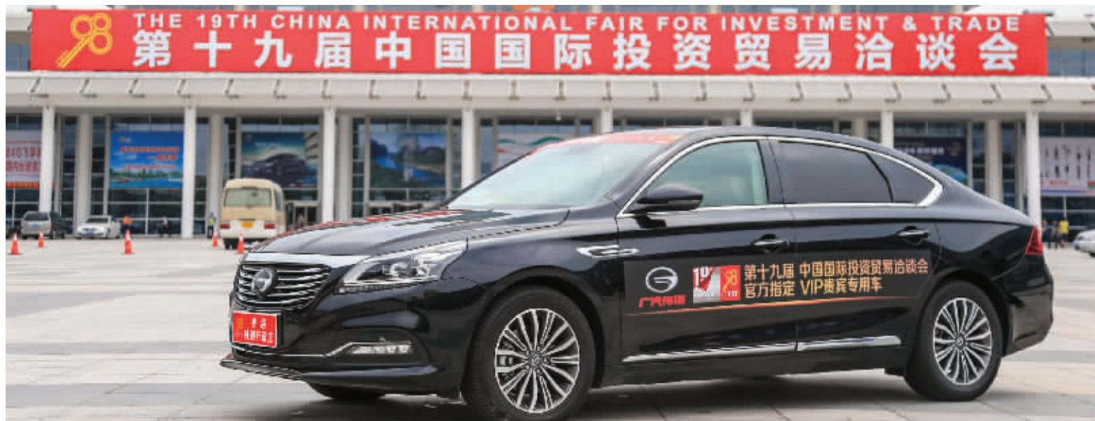
150辆传祺GA8/GA6担任2016投洽会唯一贵宾接待车

2016年投洽会恰逢世界经济风云变幻,中国市场成为世界关注焦点。传祺代表中国汽车制造的高水平与各位政要嘉宾亲密接触,为其提供优质、安全服务的同时,也是中国智造、中国经济发展的一个好见证。