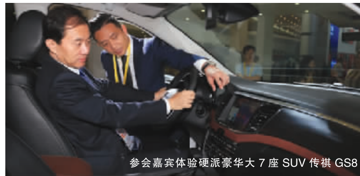
参会嘉宾体验硬派豪华大7座SUV传祺GS8

本届投洽会上,“国宾座驾”传祺GA8首度“参会”,高端、尊贵的产品形象与各国嘉宾的身份地位相匹配,宽敞的乘坐空间与富有中国韵味的整体设计令所有乘坐嘉宾倍感愉悦与舒适。