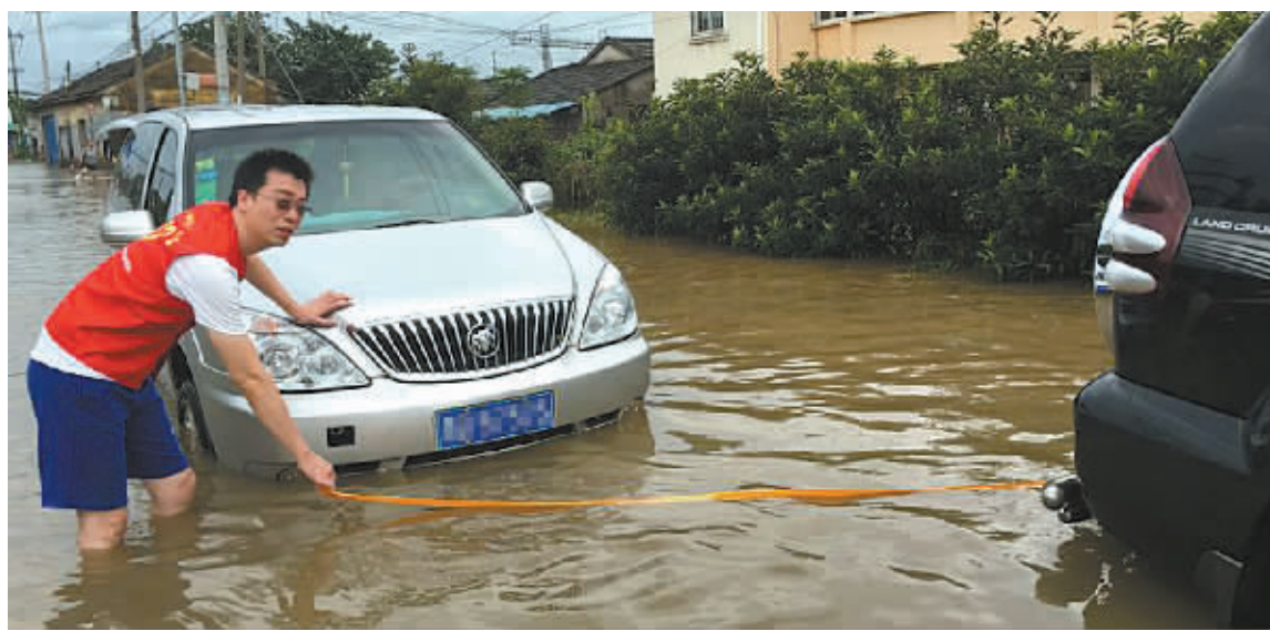
台风天，“保险方舟”在行动。

根据宁波保监局统计，今年台风“莫兰蒂”影响宁波期间，共有150名来自我市保险行业的志愿者在全市50余个积水较为严重的路段、桥洞，实行24小时专人值守，提醒过往行人、车辆注意安全，协助做好受淹车辆施救等工作。值守期间，志愿者们共劝退车辆500余辆。