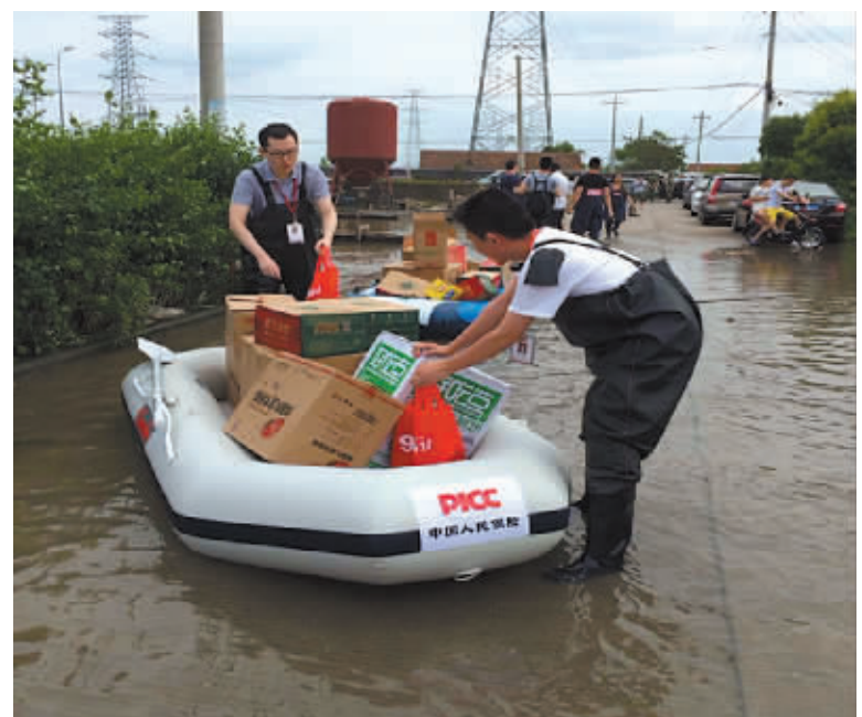
志愿者在运送救援物资。

下一步，“保险方舟”将继续打造“总队+大队+分队”的三级志愿服务工作组织体系，通过微信等平台建立更高效的互动平台，并进一步扩大志愿服务领域，做好项目认领对接，扩大志愿服务的社会影响力。