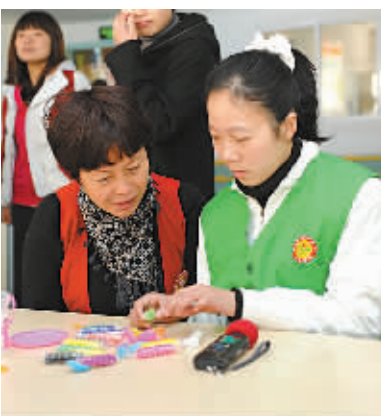
“保险方舟”志愿者到阳光驿站开展联谊活动。