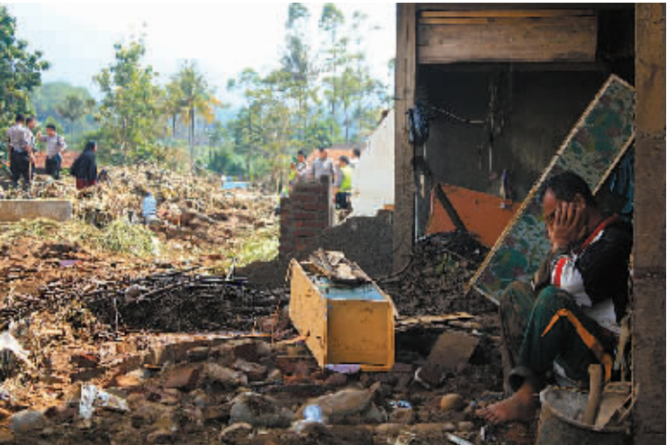
9 月 21 日,在印度尼西亚西爪哇省加鲁特县,一名村民坐在被山洪摧毁的自家房屋前。 印度尼西亚官员 21 日说,西爪哇省因暴雨引发山洪和滑坡,已造成 23 人死亡,另有 15 人失踪。